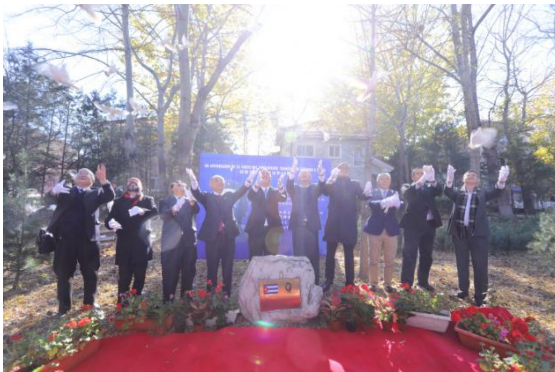
(图：中古两国和苑博物馆纪念切·格瓦拉访华 60 周年)