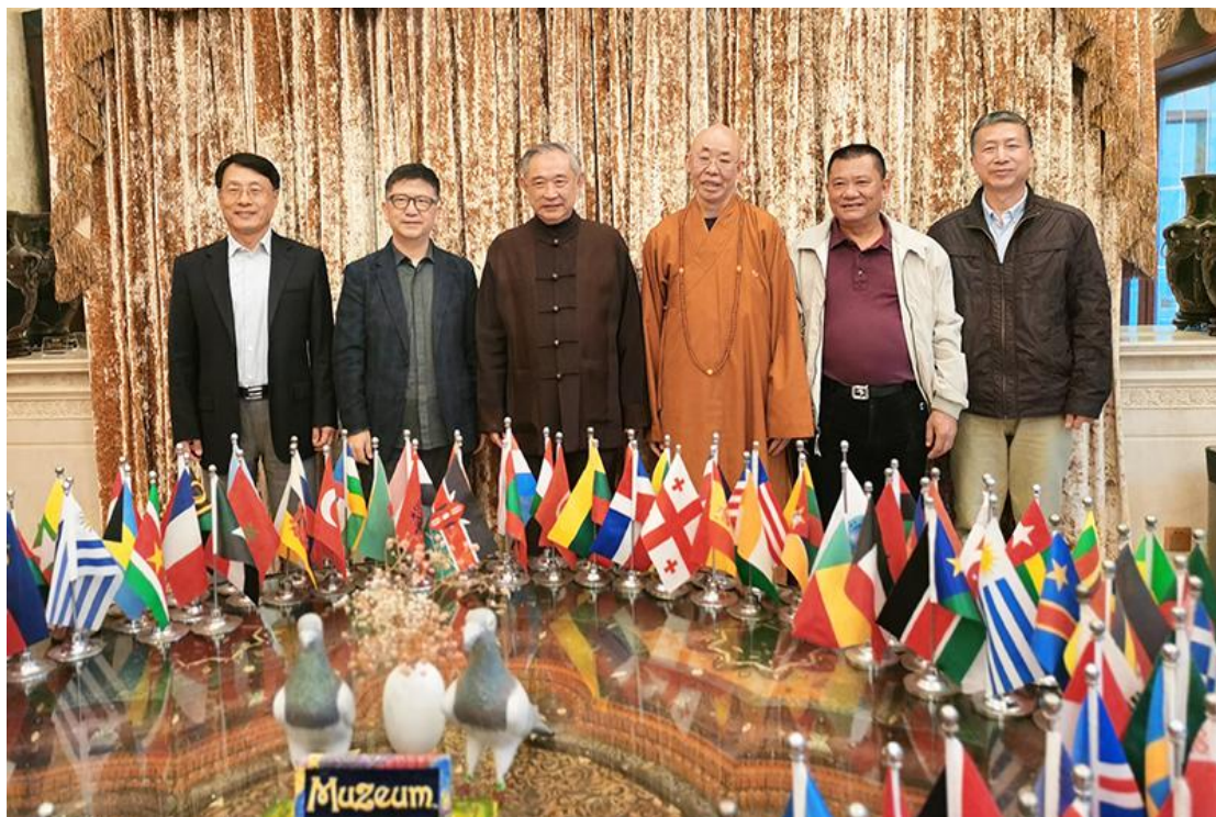
（图：圆融文化谈公益 一带一路结善缘）

4. 基金会在两个循环思想基础上，在加强国际交往合作的同时，也注重与国内政府保持一致，与相关政府部门和企业密切沟通合作，希望通过加强政府与民间的合力，为“一带一路”和北京“四个中心”建设多做实际工作。先后与统战部、民委、侨联、奥组委、中联部、国有文化资产管理中心、文投中心等交流互动，建立沟通机制，寻求在华人华侨、民族宗教、文化产业等领域进一步扩展公益合作项目。