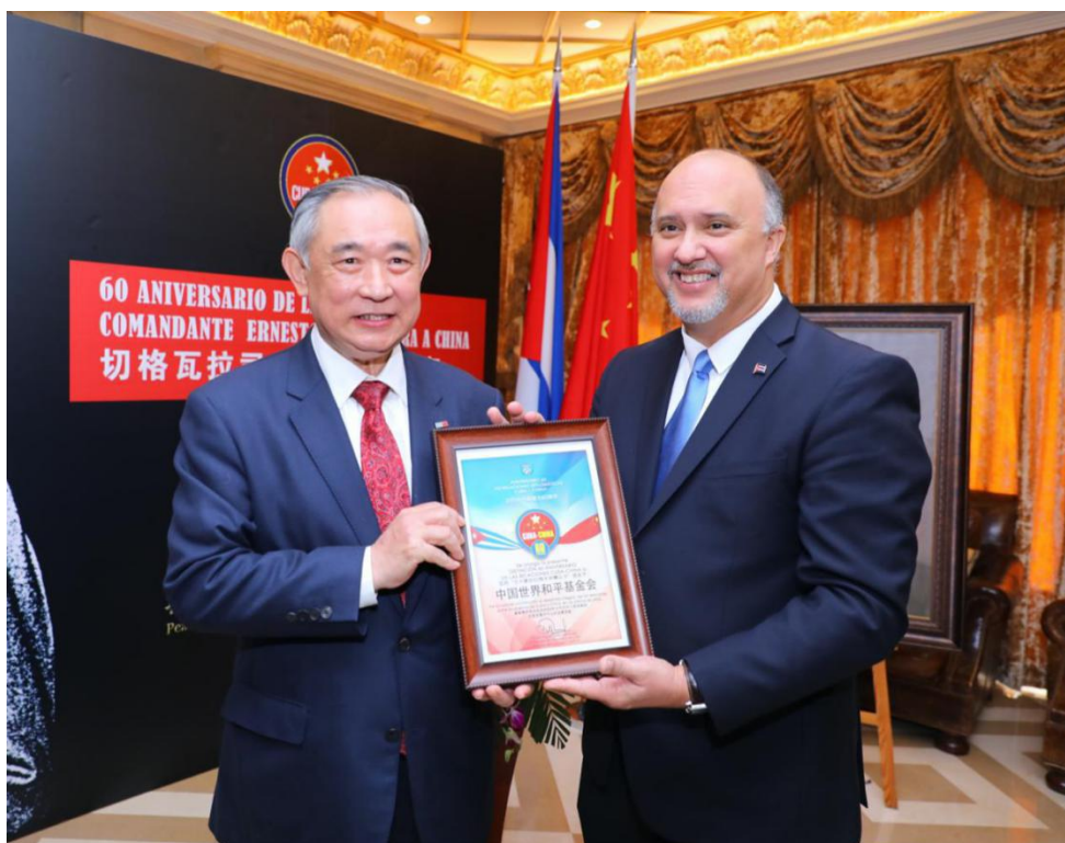
(图：古巴驻华大使为我基金会颁奖)