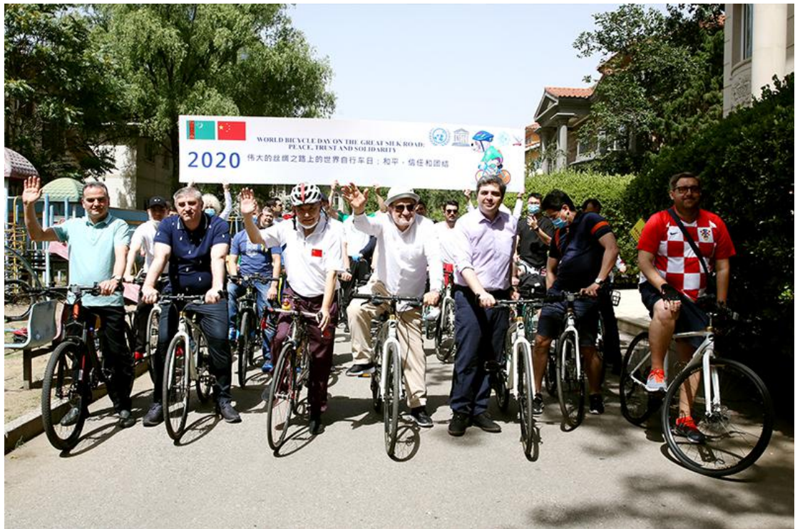
（图：“伟大的丝绸之路上的世界自行车日”骑行活动）

各国在活动中签署了携手共建“和平、信任、团结、绿色、文明、包容和共享”的“一带一路”《和平倡议书》，同时支持香港国安法立法，维护区域和平。此举不仅推广了节能环保可持续的绿色行动，还与各国分享了抗疫中的医疗保健知识，所有参加活动的国际友人都获赠了多样性的急救包。这个集多重意义为一体的团结抗疫活动不仅得到国际社会的高度评价，也将成为可持续发展并具有多边国际合作的项目，深化“一带一路”国家的务实合作。