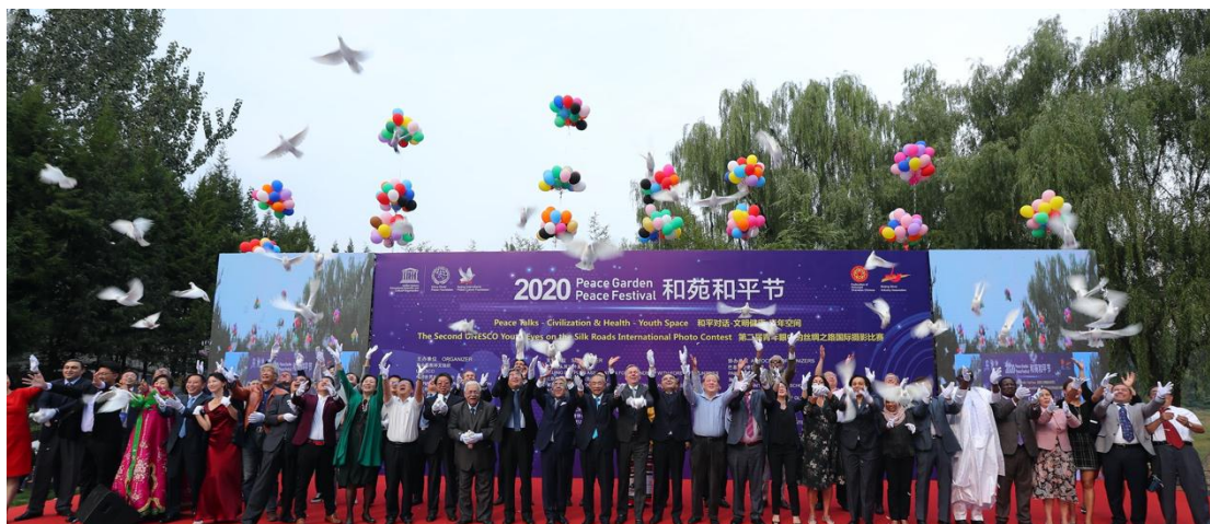
(图：第七届“和苑和平节”放飞和平鸽)

在宣读联合国教科文总干事贺词、共同放飞和平鸽、播撒“丝路花园”和平种子后，多国政要、驻华大使和青少年代表就后疫情时代的和平对话、文明健康、青年空间等主题发表精彩演讲。同时，奥地利驻华大使代表奥地利政府和 NGO 与我们签订协议，将“中国奥地利志愿者基地”落户在我们基金会社区。联合国教科文组织官网对本次活动进行了全球直播，据不完全统计，线上有 3 万余人同时收看庆典活动。