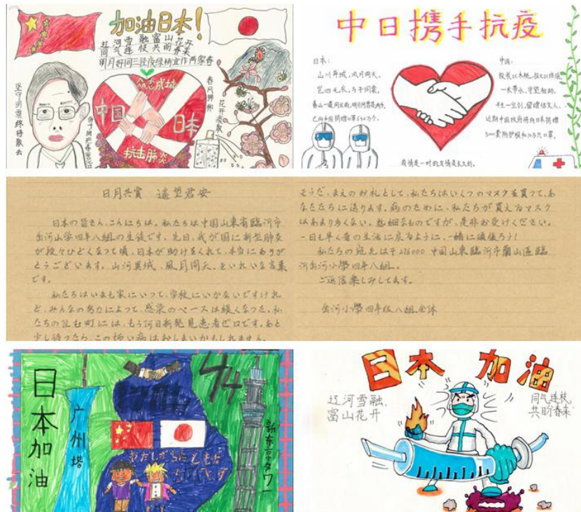
(图：山东临沂小学生为日本人学校捐赠口罩和表达美好祝愿)