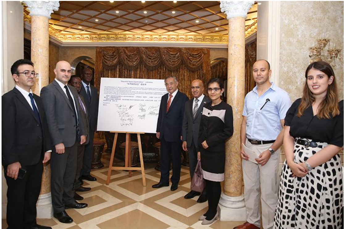
（图：联合发起“和平探索太空”倡议）

促进“一带一路”太空科技和平公益。来自一带一路沿线、欧洲、美洲、非洲地区等 12 个国家的驻华使节、科研组织、企业家、科技文化界代表和青少年代表参与了本次活动并共同发起“和平探索太空”的倡议。