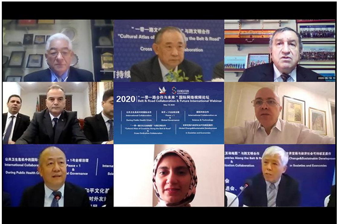
(图：“一带一路合作与未来”国际网络视频论坛)

4. 在今年6月3日联合国“世界自行车日”，我们以此为契机，与中立国土库曼斯坦驻华大使馆共同邀请了15国驻华使节、外交部和上合组织代表，举办了“伟大的丝绸之路上的世界自行车日”骑行活动。