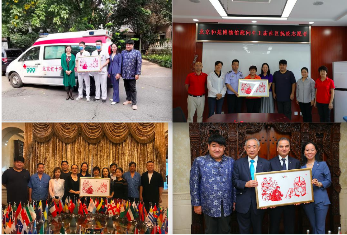
（图：基金会抗议文创作品捐赠）

3. 基金会与中国首家佛教协会旗山万佛寺，共同发起“佛教圆融文化公益基金”，以和平为主题，以文化艺术为载体，以公益为形式，动员广泛的社会力量，结合互联网的科技优势，推广佛教文化艺术和非物质文化遗产，推进和平事业。