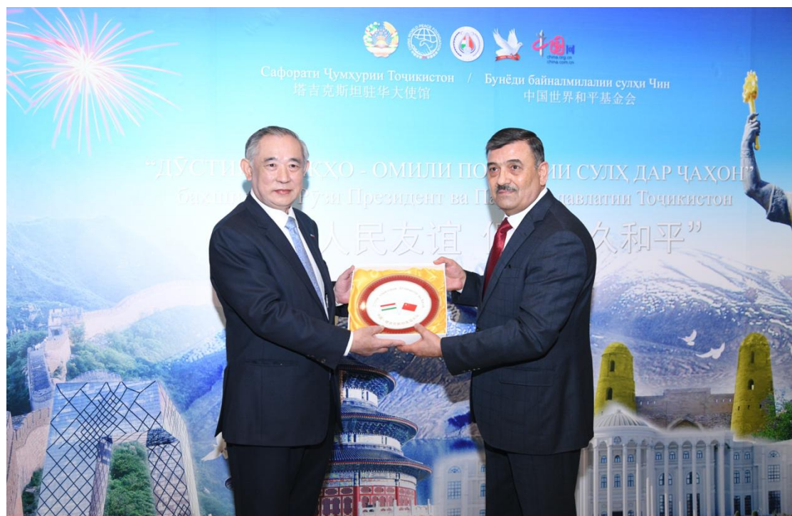
（图：塔吉克斯坦驻华大使为我基金会颁奖）

13. 在 11 月 21 日塔吉克斯坦共和国总统日和国旗日，基金会与塔吉克斯坦驻华使馆共同举办了“增进人民友谊促进持久和平”的交流互动，深化了中塔两国友谊。参会嘉宾表示，经济社会合作是两国的共同愿望，而丝绸之路文化互动，合理配置全球资源，提高人民生活水平、地区和平安全将是中国与中亚多边友好发展的着力点，和平公益在中亚地区大有作为。驻华大使代表塔吉克斯坦政府向我基金会颁发了奖章。