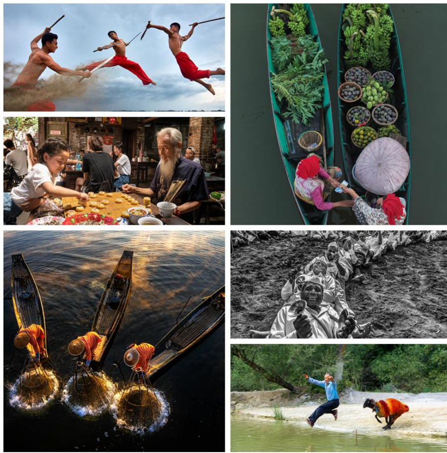
（图：全球青少年摄影比赛，疫情下外面的世界依然美丽）

2. 我会抗衰老与疾病专项基金负责人在国家科技部支持下进行相关研发；协调组织了山东临沂少年儿童为日本学校捐赠的口罩、书信和儿童画捐赠给日本人学校。日本驻华大使横井裕先生特别致信给基金会李若弘主席说：“尽管全球疫情仍处在十分严峻的挑战阶段之中，但是包括民间在内的日中各界却自发地展现出守望相助的姿态，这无疑让人感到十分欣慰，体现了日中两国人民的深厚渊源。”目前，中日学校也表示疫情之后会开展更深入的交流。